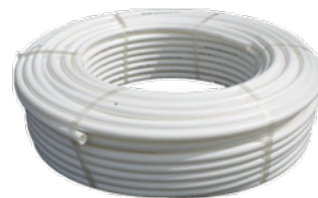
Neotherm PE-RT gulvvarmerør