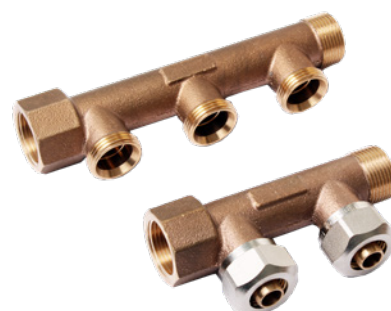
Rødgods fordelerrør 2 afgange

Vi tilbyder kvalificeret, praktisk rådgivning fra udbud til projektet afleveres. Gennem direkte leverancer og dialog har vi tæt kontakt til vores kunder, hvorved vi sikrer den bedste kvalitet til den rigtige pris.