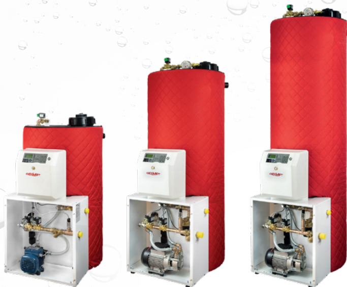
HC9 100 B