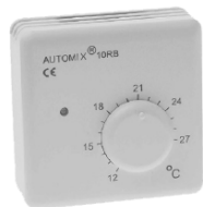
Rumføler AUTOMIX 10 RB