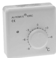
Fjernkontrol AUTOMIX 10 RC