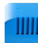
Ventilations- åbninger i henhold til sikkerheds- forskrifterne